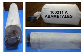
Empaquetado Ánodos de magnesio