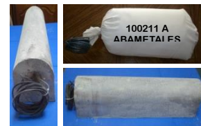
Empaquetado Ánodos de magnesio