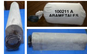
Empaquetado Ánodos de magnesio